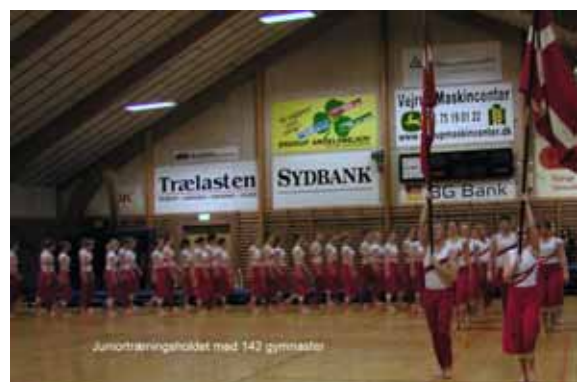
Juniortræningsholdet, hvor der var 7 lokale gymnaster med på holdet.